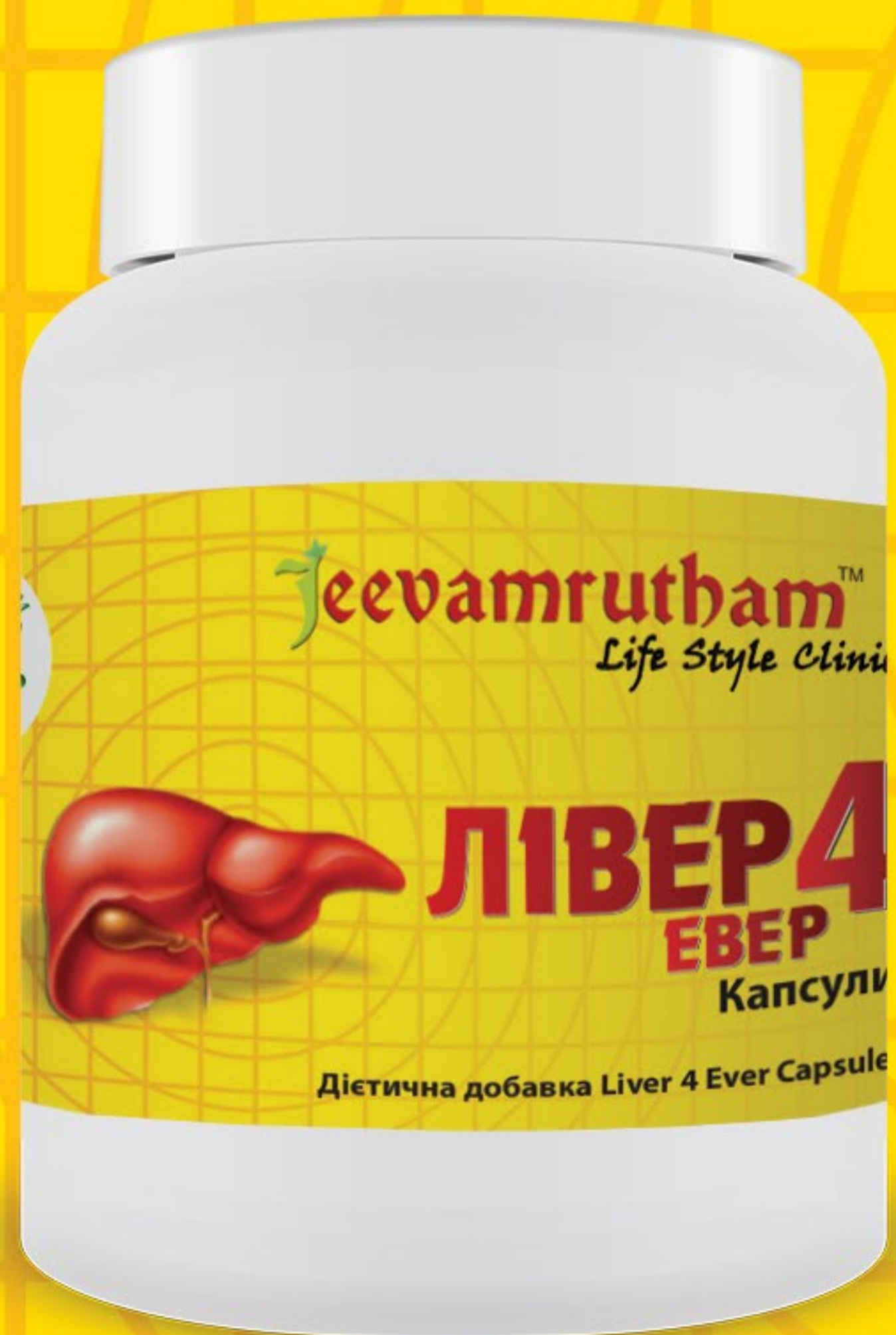
Дієтична добавка Liver 4 Ever Capsules